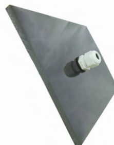
Герметичный кабельный ввод