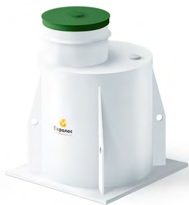
Пластиковый кессон 5 с горловиной